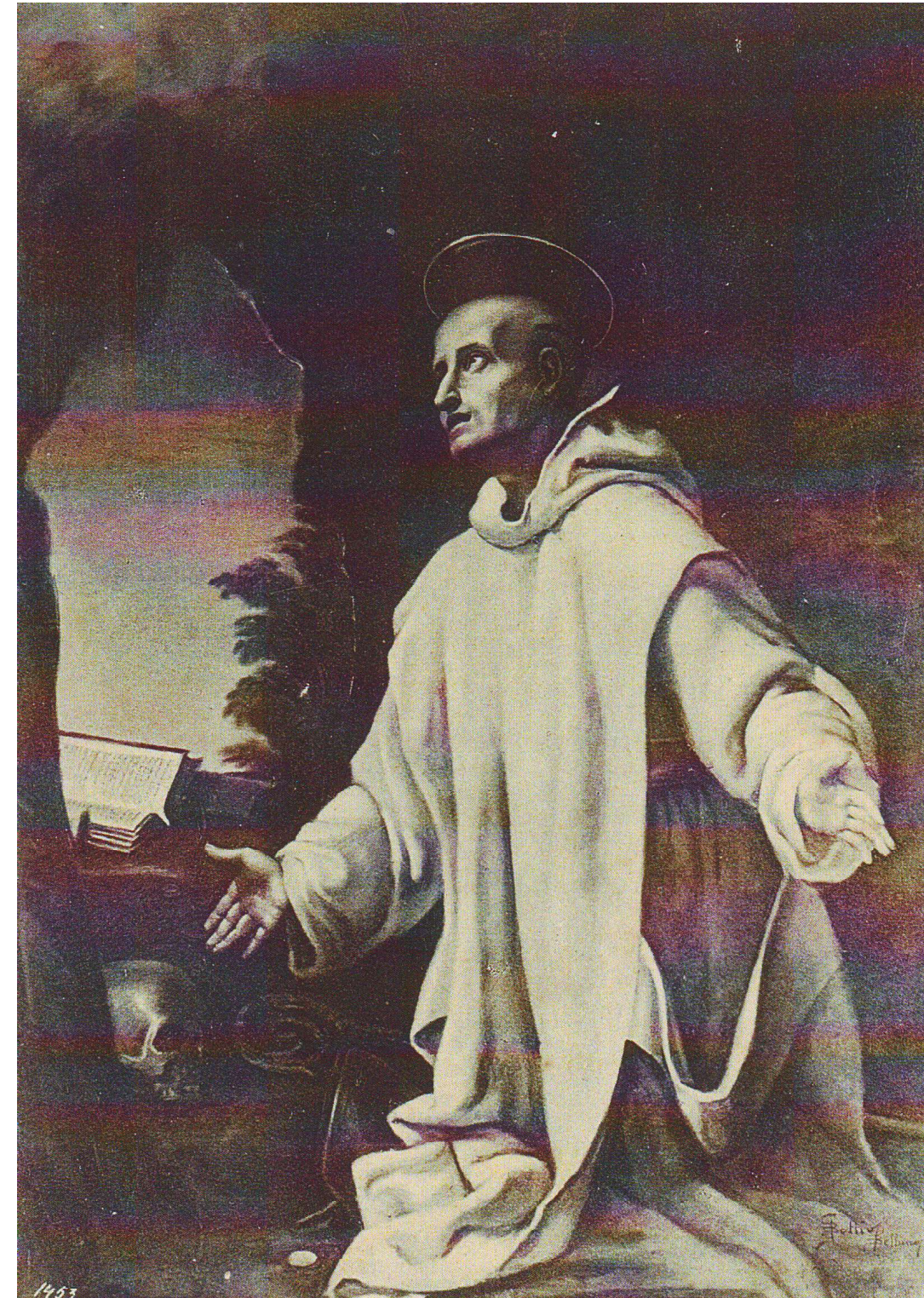
CERTOSA DI CALCI (Pisa) S. BRUNONE fondatore del Sacro Ordine Certosino - 1084 (Quadro del Vanni)