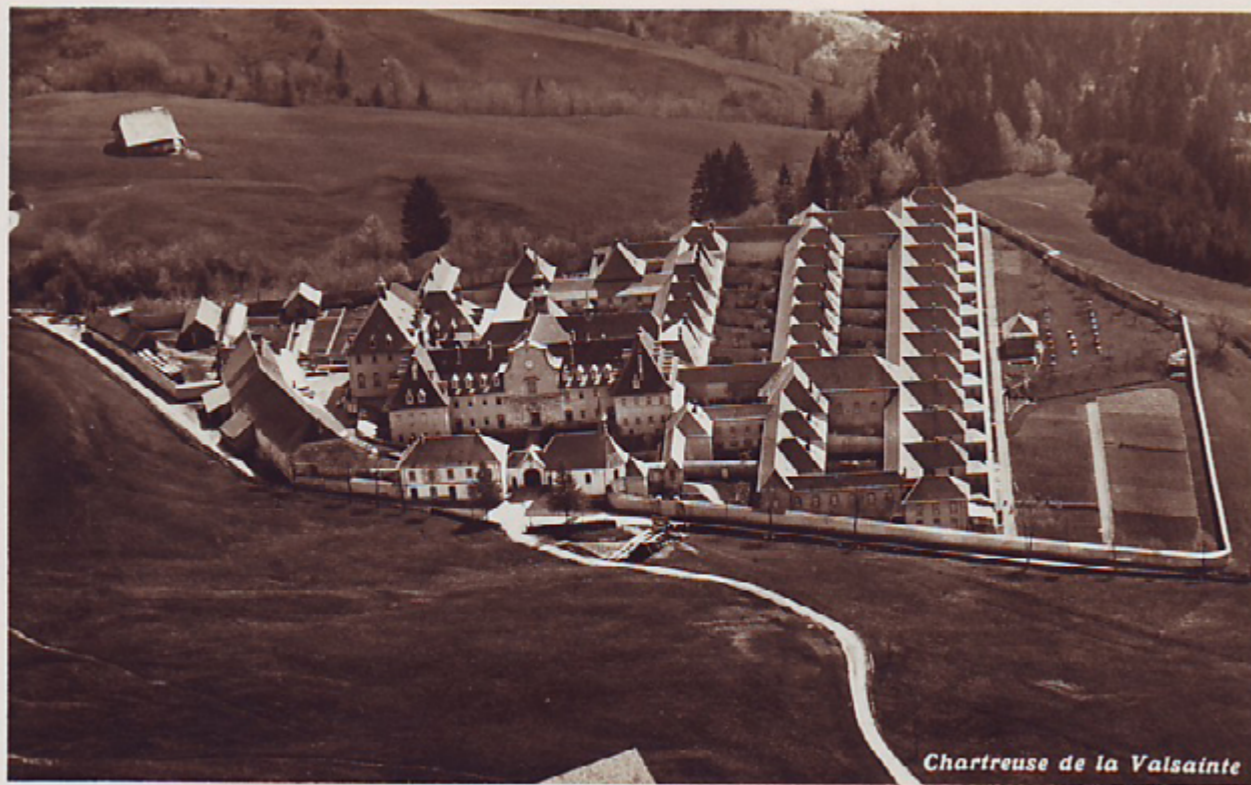
Chartreuse de la Valsainte