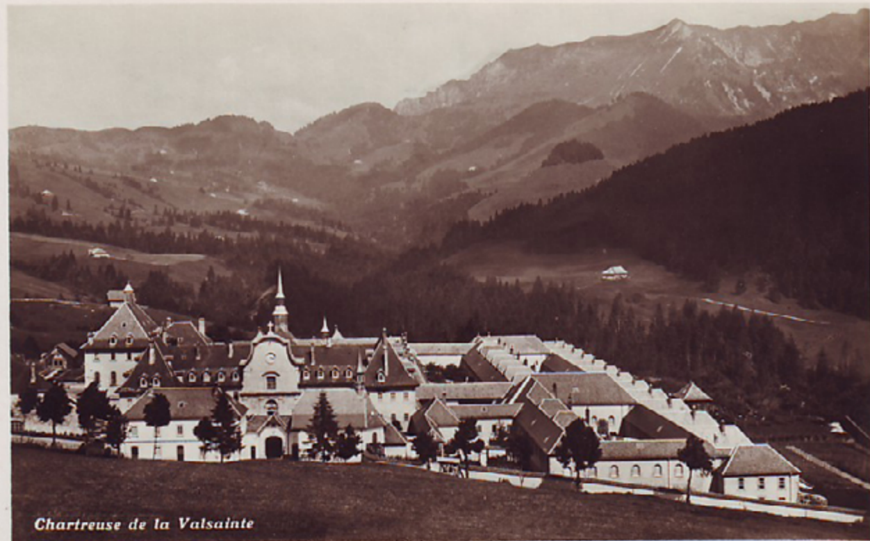
Chartreuse de la Valsainte