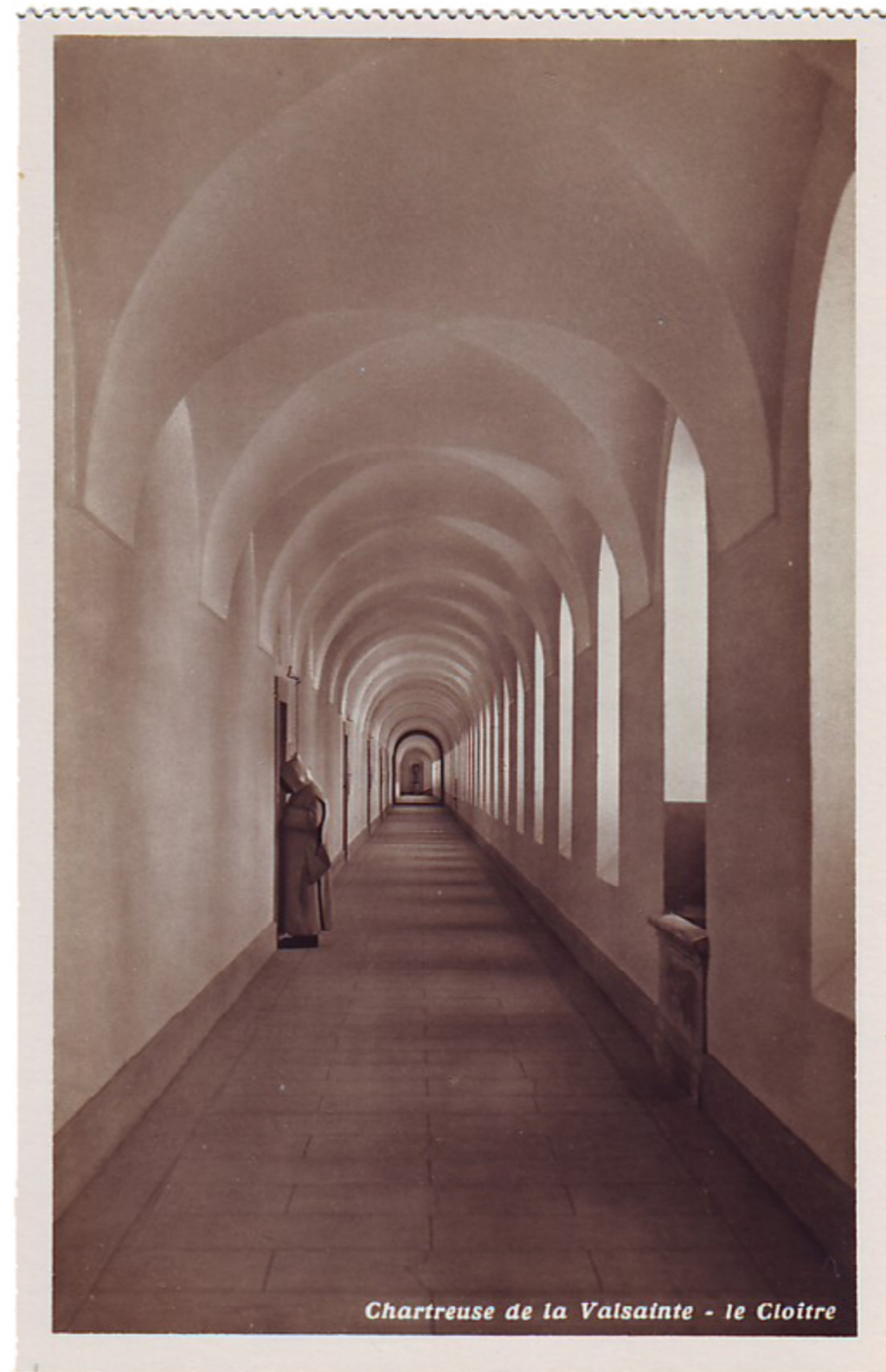
Chartreuse de la Valsainte - le Cloître

om de heilige intentie te hebben het beste te intenderen : U aanwezig te laten zijn in mijn simpele aandachtigheid.